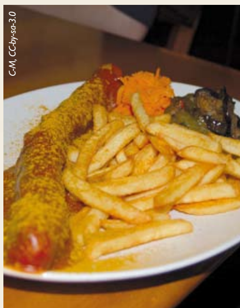
Lieblingssessen der Leipziger?

Der Stammtisch in Leipzig ist mittlerweile schon ein kleiner Freundeskreis geworden.